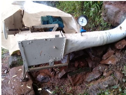
Fig.2. Turbina, Manómetro y Generador de Prueba

Esta turbina es de menor tamaño, pero de similares características, a la que se implantará en el proyecto. La altura de salto neto que se utilizó fue de 5 metros, el caudal de 30 litros por segundo, el motor empleado como generador fue marca WEG que trabaja a 1000 RPM de velocidad de giro en su eje, 50 Hz de frecuencia, potencia nominal de 2 kW. Para la alimentación de agua a la turbina se utilizaron tubos sanitarios de PVC de 160 mm de diámetro, lográndose una velocidad del agua de 2 m/seg. Bajo estas condiciones la potencia obtenida en el ensayo fue de 1 kW, la cual está acorde a lo previsto y da indicios que para el equipamiento que se está proyectando instalar se obtendrán los resultados estimados. La experiencia posibilitó refutar los valores de rendimiento que se estiman en los cálculos para la determinación de la potencia útil que se puede extraer del aprovechamiento hidráulico. En este sentido el proyecto sobre el arroyo Trigueriño podría aportar un total de 12 kW, tal cual lo comentado en apartados anteriores; sin embargo, para no ocupar totalmente el caudal natural del curso de agua y por ser un proyecto del tipo prototipo con fines educativo y demostrativo, se instalará equipamiento para obtener 3 kW de potencia, que abastecerá adecuadamente a la demanda descrita.