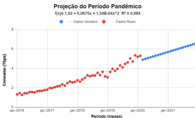
Figura 2: Projeção da curva do crescimento do tráfego de dados no Brasil, em Tbps, de jan/2016 até dez/2021.

Na Figura 2, é apresentada a curva que descreve o modelo matemático da projeção do tráfego de rede, caso a pandemia não tivesse acontecido. Para isso, foram utilizados os dados de janeiro de 2016 a fevereiro de 2020, e utilizando o FORECAST do Google Planilhas, foi previsto os dados do período entre março de 2020 a dezembro de 2021. Ao realizar a análise detalhada, o comportamento dos dados no gráfico, pode ser representado por uma regressão polinomial de grau 2.