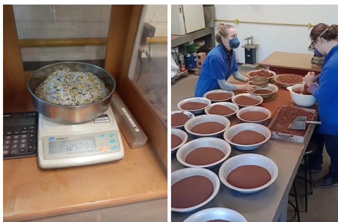
Figura 1: Preparação dos Materiais

Inicialmente, para começar a pesquisa foram estudadas e interpretadas as NBR's necessárias para a execução com eficiência das amostras e exatidão dos dados coletados. Conforme a figura (1) a seguir foi executada a preparação dos materiais para os ensaios, onde foi separado as amostras de PEAD que utilizou-se. Ademais, o solo foi destorroado e peneirado, por fim adicionado em bandejas.