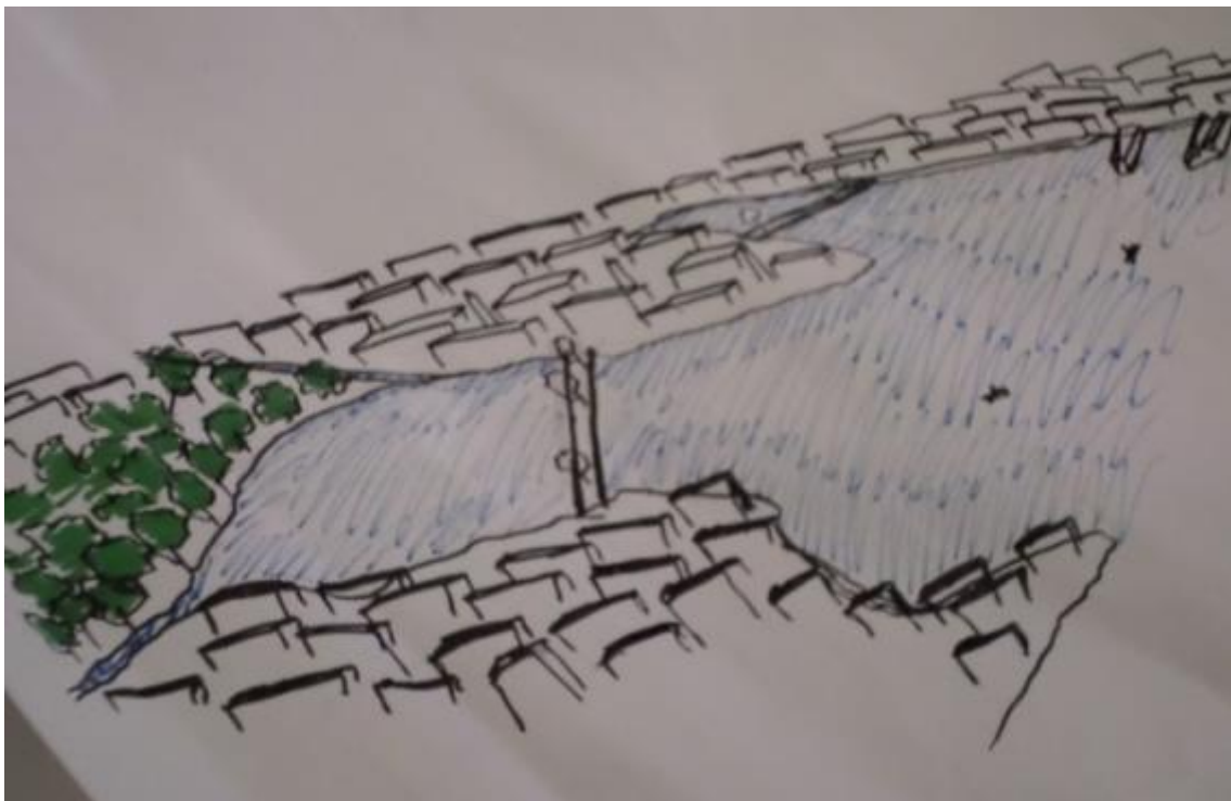
Figura 2 – Esboço que mostra um dos resultados da intervenção no local.

Modalidade do trabalho: Relato de experiência Evento: XV Jornada de Extensão