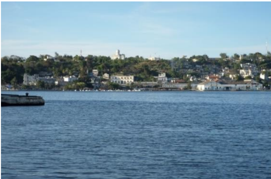
Figura 1 – Bahia de Havana, local para o qual os estudos se desenvolveram.

Modalidade do trabalho: Relato de experiência Evento: XV Jornada de Extensão