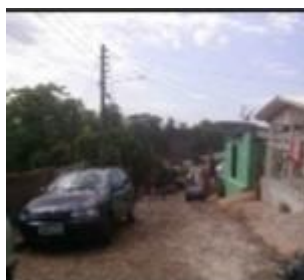
Ocupação do bairro sem planejamento urbano Feita pelos moradores