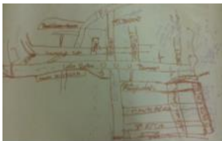
Figura 3 - Mapa conceitos do Presente. (elaborado pela comunidade).

Modalidade do trabalho: Relato de experiência Evento: XVI Jornada de Extensão