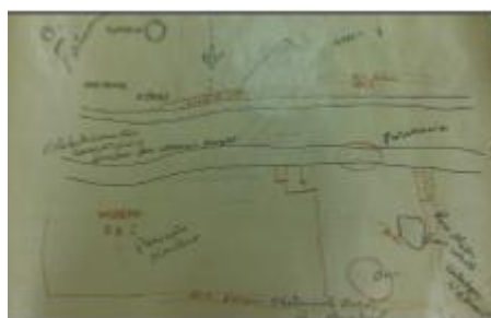
Figura 4 - Mapa conceitos do Futuro. (elaborado pela comunidade).