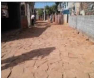
Rua Cabo Rocha tem um muro que impede a construção do passeio público

Modalidade do trabalho: Relato de experiência Evento: XVI Jornada de Extensão