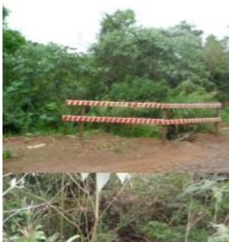
Pontos de esgoto a céu aberto que deságuam no rio Lajeado Perai, sem tratamento