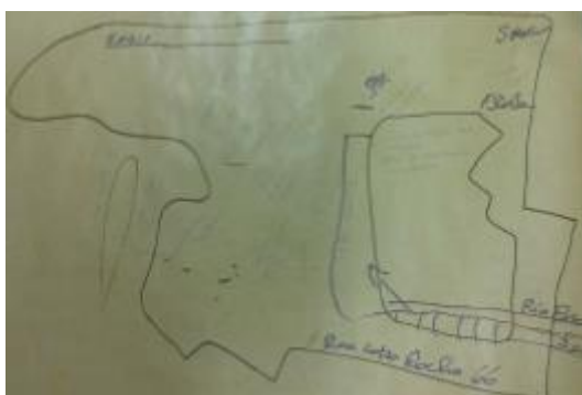
Figura 2 - Mapa conceitos do Passado (elaborado pela comunidade).