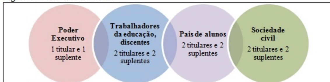
Figura 1 – Estrutura do CAE.

Quanto à participação do CAE no município, este órgão é bem ativo e participativo, sendo constituído por membros do Executivo, representantes da escola, de pais de alunos, de professores da rede municipal e também da sociedade civil (Unijuí e Emater), conforme a Figura 1.