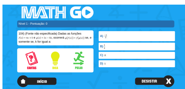
Figura 4 - Tela de perguntas

Ao iniciar a partida, o jogador deverá informar seu nível, para a seleção de perguntas. Logo após a partida ser iniciada, são apresentadas perguntas para que o aluno responda.