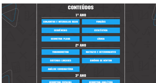
Figura 5 - Lista de conteúdos

Este módulo não possui pontuação nem limite de dicas. Foi projetado diretamente para estudo e treino para posteriormente ir para a partida com pontuação no módulo jogo.