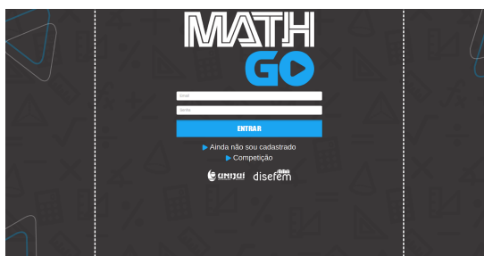
Figura 1 - Tela de login

Quando o aplicativo é acessado, tem-se a tela inicial, apresentada na Figura 1, na qual é possível fazer o login para jogar, estudar, atualizar os dados pessoais, fazer cadastro no sistema e ainda acessar modo competição.