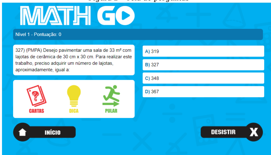
Figura 2 - Tela de perguntas

Ao logar pela primeira vez, o estudante ou professor deverá informar seu nível, para a seleção de perguntas. Logo após a partida é iniciada e são apresentadas perguntas para que o aluno responda. Um exemplo da interface das questões pode ser visualizado na figura 2.